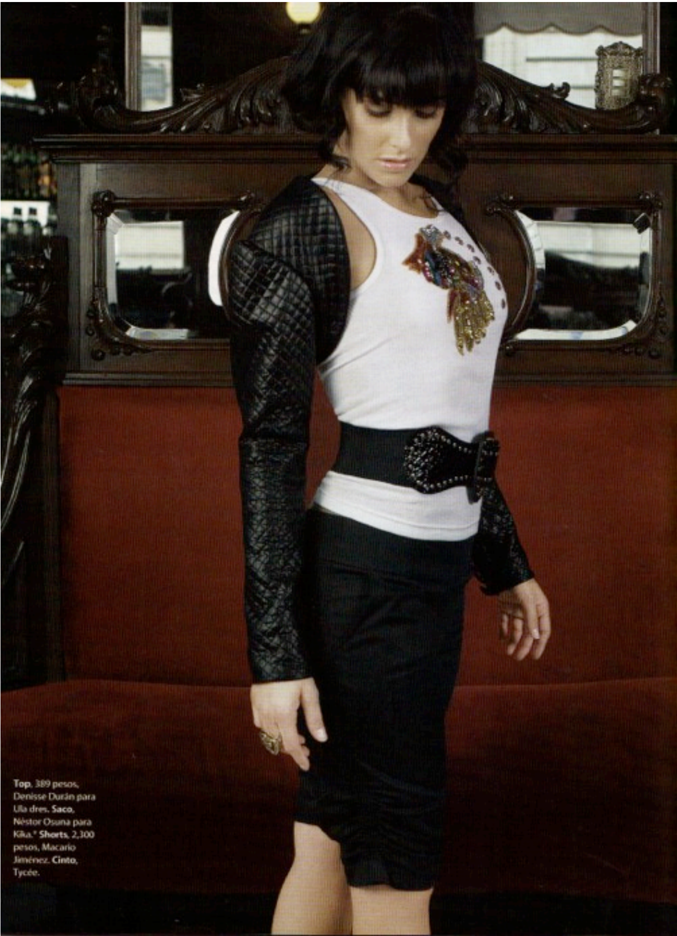
Top, 389 pesos, Doris Durán para Ula dres. Saco, Néstor Osuna para Kika. Shirts, 2,100 pesos, Macario Jiménez. Cintó, Tycón.