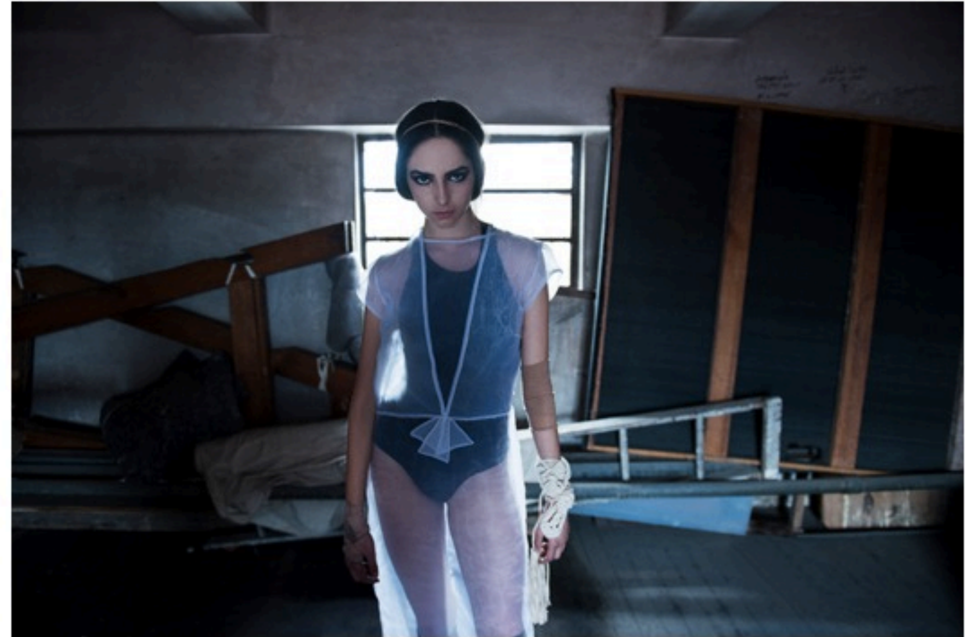
1. Vestido Nestor Osuna Estilista Vica Papuchi

C uando era niña quería ser bailarina de ballet; me fascinaba imaginarme en el escenario girando y saltado como lo hacían en Lago de los Cisnes que vi en en Chapultepec. Un tutú rosa me acompañaba todas las tardes en mis primeros pasos, aquellos que no le importaban si tenía talento o no. Sólo quería bailar como en aquel ballet legendario. Creo que ese mismo deseo ha permanecido en la mente de muchas otras niñas y niños; algunos